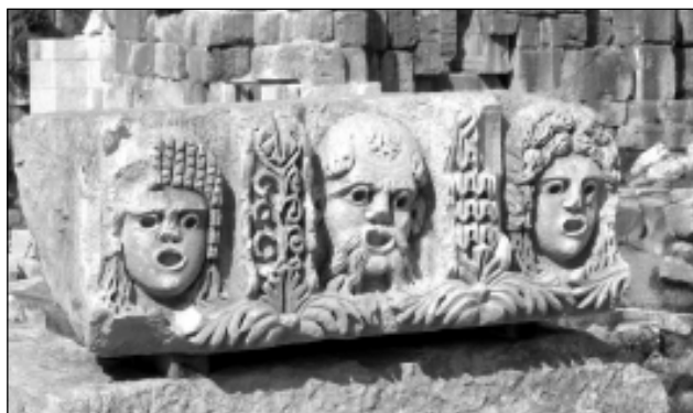
Kamienne maski, „Amfiteatr Masek” w Mirze (Myra)

w prawej dłoni pastorał, którego zwieńczeniem jest maska zamiast krzywaśni. Zaskakujące przedstawienie. Ale, kiedy dowiemy się, że w Mirze, miejscu, gdzie ów Święty prowadził działalność misyjną, jest rzymski amfiteatr, przy którego wejściu położone są potężne kamienie z wrytymi na nich maskami w liczbie 16. Stąd też amfiteatr ten nosi nazwę „Amfiteatr Masek”.